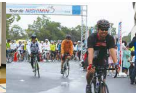
ツール・ド・西美濃