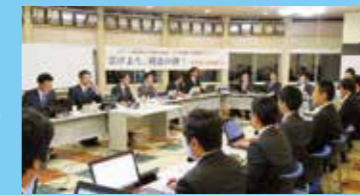
理事会開催の様子

各委員会より提出された事業計画案は、常任理事会及び理事会で協議・審議されていきます。