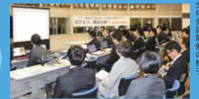
全体会議開催の様子

大垣青年会議所全体で取り組む事業は、全会員が目的や手法を理解した上で実施できるよう全体説明会を開催した上で実行されます。