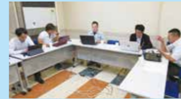
委員会開催の様子

公益社団法人大垣青年会議所では、様々な事業を行う目的を定め、各委員会が開催されます。