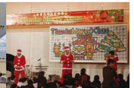
新入会員による交流会(クリスマス家族会)