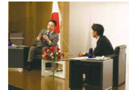
日本JC直前会頭による講演

青年経済人として必要なビジネススキル、コミュニケーションスキルなどの向上やリーダーシップ育成を行い、自分磨きに努め良き人材へと成長します。