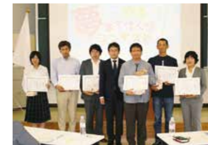
まちづくりコンテスト

市民や行政の共感を得ながら、政策提言集団としてまちづくり運動を展開しています。自ら先頭に立ち、環境美化や地域の魅力再発見、自分たちの大垣の活性化に若いエネルギーを燃やしています。